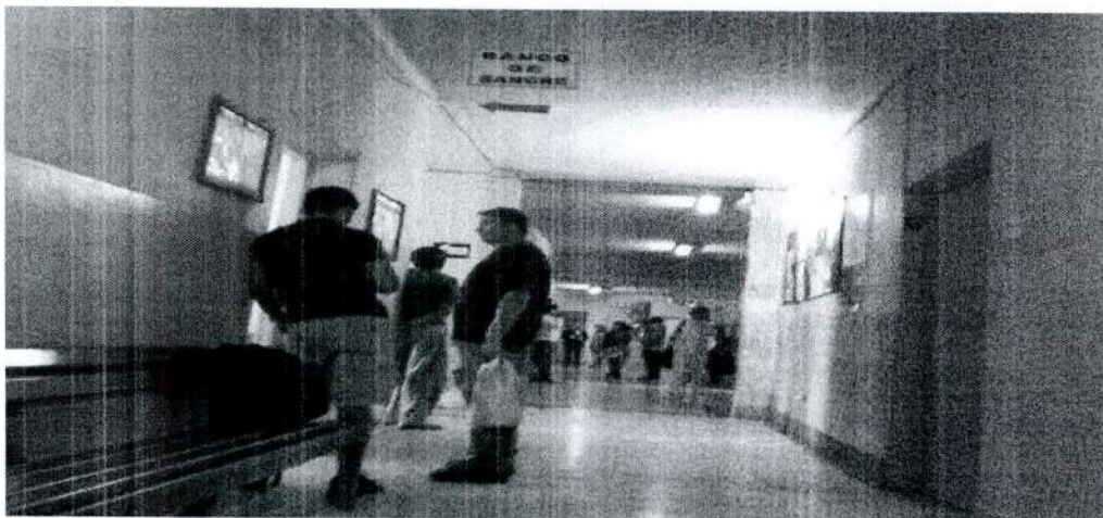
"Vampiros" merodean los hospitales locales

Falta de donación voluntaria de sangre propicia peligroso comercio ilegal. Comercializadores piden entre 70 y 500 soles por una unidad de acuerdo al tipo de plasma.