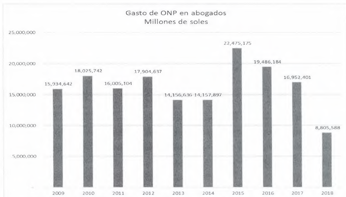
Gráfico N° 01 5

El informe periodístico muestra un caso en diciembre del año 2015, en el cual la ONP canceló S/198, 200 soles a tres abogados expertos en materia previsional, que se encargarían de los procesos judiciales que plantean los cesantes y jubilados al Estado peruano.